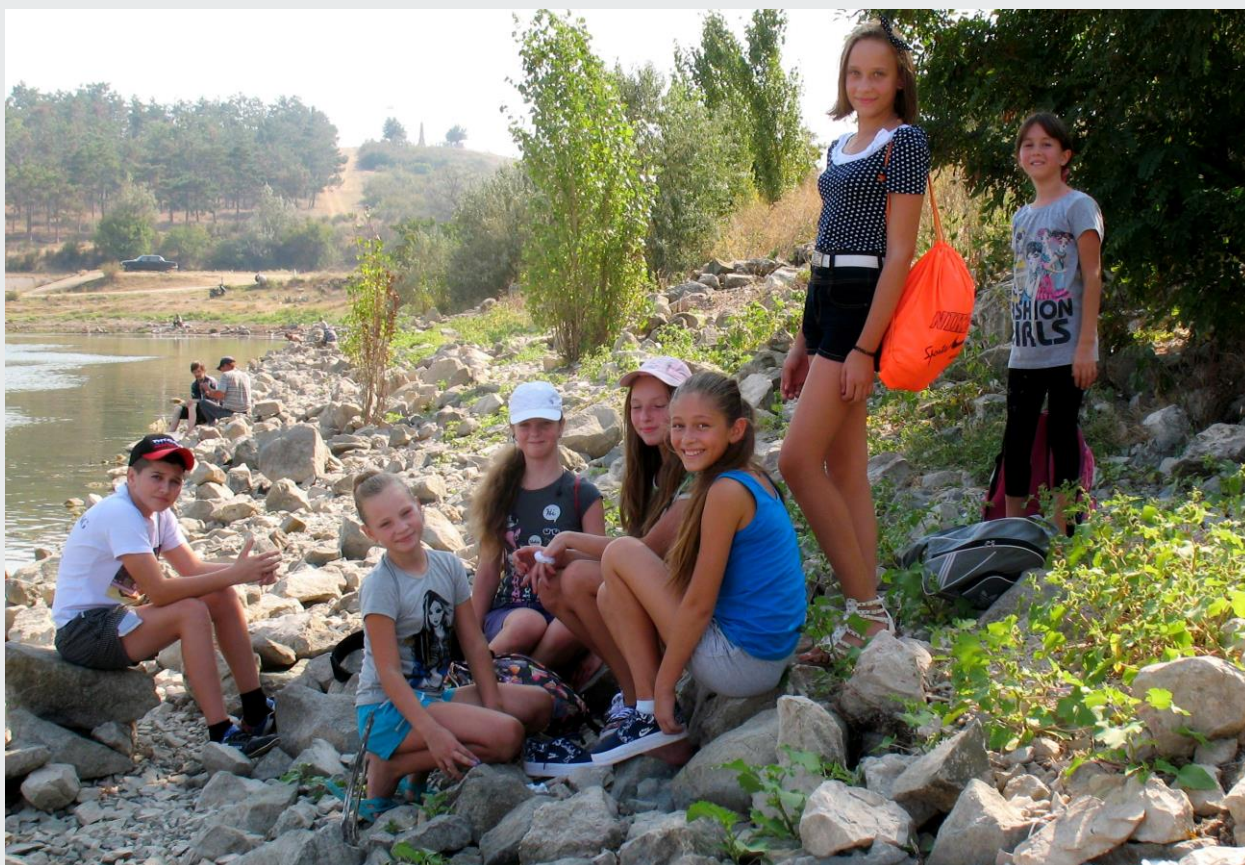
Учащиеся 7-б класса на экскурсии «Река Западный Булганак»