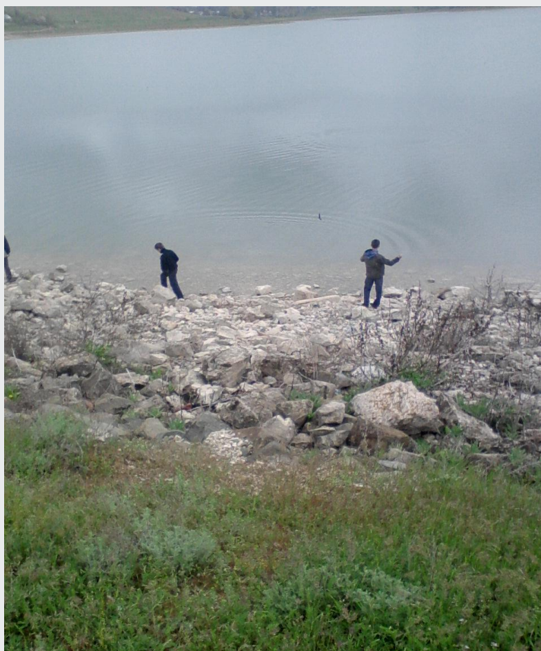
Учащиеся 5-а класса участвуют в уборке берега реки